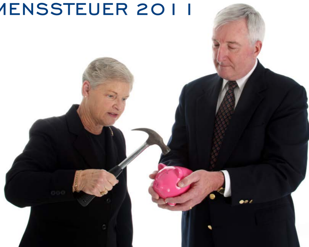
Im Gegensatz zu Deutschland werden in Spanien die Renten zu 100% versteuert. Das kann teuer werden!