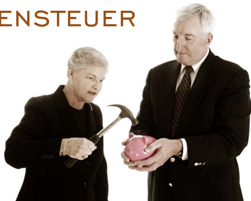
Im Gegensatz zu Deutschland werden in Spanien die Renten zu 100% versteuert. Das kann teuer werden!