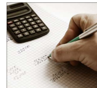
Spanien hat 2012 die Steuern erhöht. Welche Auswirkungen hat die Erhöhung der Einkommensteuer auf Ihren Lohn? Wer ganz sicher sein will, lässt sich vom Fachmann beraten.

zug bringen. Aber nur wenn die Mutter einer mindestens halbtägigen Tätigkeit nachgeht.