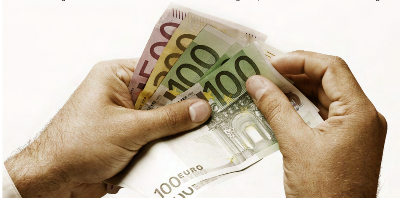
Residenten in Spanien müssen Anfang 2013 ihr gesamtes Auslandsvermögen offenlegen. Wer das nicht macht, dem drohen drakonische Strafen.

Es handelt sich um die Offenlegung ausländischem Vermögen. Somit will der spanische Staat an das Geld der Residenten, um hier die Vermögenssteuer abzukassieren. Lesen Sie hier die Fortsetzung des Gesetzes in der deutschen Übersetzung.