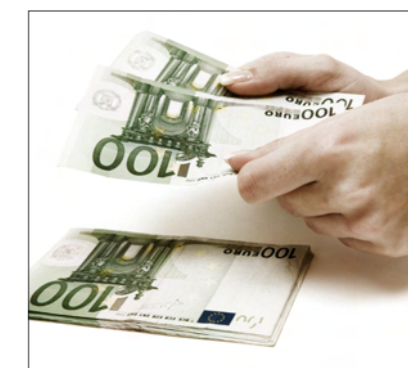
Spanien bittet alle Residenten durch das neue Gesetz zur Kasse. Sofern Sie sich angesprochen fühlen, sollten Sie schnellsten Ihren Steuerberater aufsuchen.

Ein Ignorieren dieses Gesetzes hat fatale Folgen!